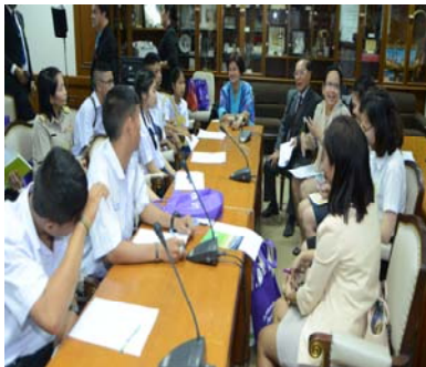
บรรยากาศการจัดทำเวทีเวิลด์คาเฟ่ (World Café)