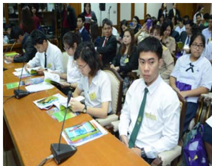
บรรยากาศก่อนการเสวนา